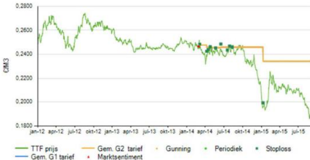
Grafiek 2. Prijsontwikkeling en inkoopmomenten aardgas

Op dit moment is 80% van het aardgasvolume voor 2016 ingekocht op verschillende momenten in 2014 en 2015. Ook hier is een daling zichtbaar van ongeveer 3% ten opzichte van 2015.